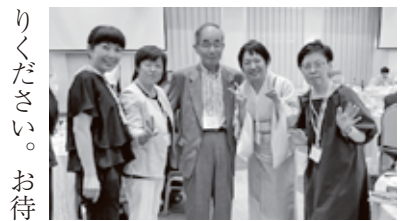
7月第一回致道館同窓会にて恩師を囲んで同期等とともに

す。カフェのような素敵な空間で懐かしい高校時代を思い出してはいかがでしょう。本校にお越しの際はぜひお立ち寄りください。お待ちしております。