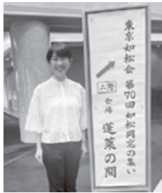
5月東京如松同窓会にて代理で出席

庄内地区にて高校教員として勤務しておりましたが、縁あってこの四月に開校した致道館高校に教頭として着任いたしました。職員は一〇〇名弱、生徒は八六八名で職員も生徒も県内トップの大手帯です。先生方はしっかりとわかるようになりましたが、生徒の皆さんを全員わかるようにはなかなかありません。しかし、授業も持っているの生徒たちがどんなふうに学校生活を過ごしているのか垣間見ることもでき、面白い日々です。伝統ある両校が一つになった新高校はいろいろな意味で可能性いっぱい的高校であると感じます。期待されているからでしょう、地域の皆様からお叱りのお電話を受けることもあります。そんなときこそ、真摯に受け止めていかなければならないと感じます。どこに勤務してもそうですが職員、生徒ともに充実した学校生活となるように一生懸命、業務に当たるのみです。両校の同窓生の皆様には鶴岡南卒、北卒という垣根を取っ払って、新高校を応援していただけるとうれしいです。鶴岡南高校を改築し、